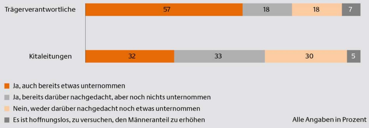
Abb. 27: Persönliches Engagement für einen größeren Anteil an männlichen Erziehern „Haben Sie schon einmal darüber nachgedacht, wie man den Anteil an männlichen Erziehern erhöhen kann bzw. etwas in diese Richtung unternommen?“